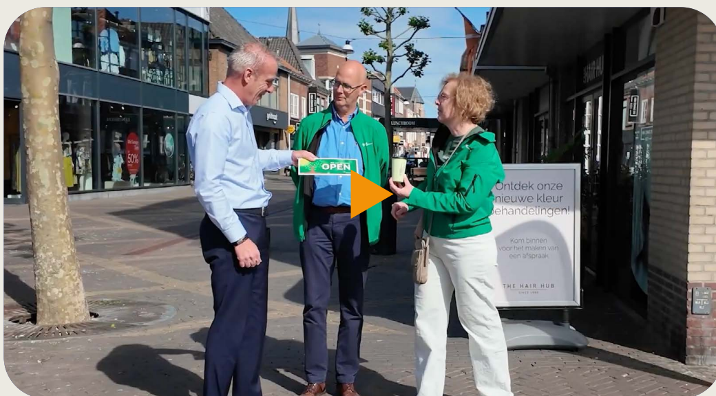
Video campagne Doetinchem