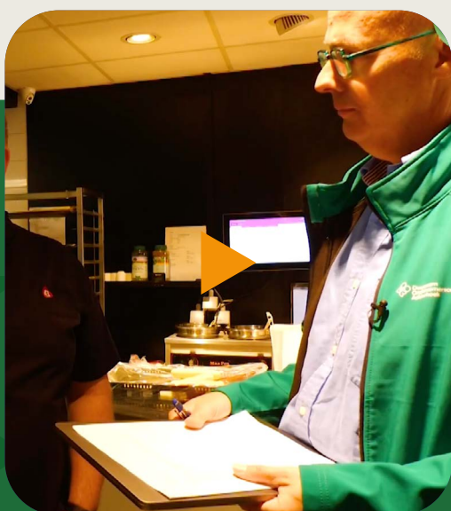
Groene impuls voor Doetinchemse ondernemers door gratis duurzaamheidscheck