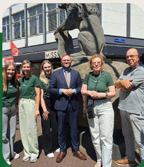
Een duurzame ondernemer is ook aantrekkelijk voor potentiële medewerkers