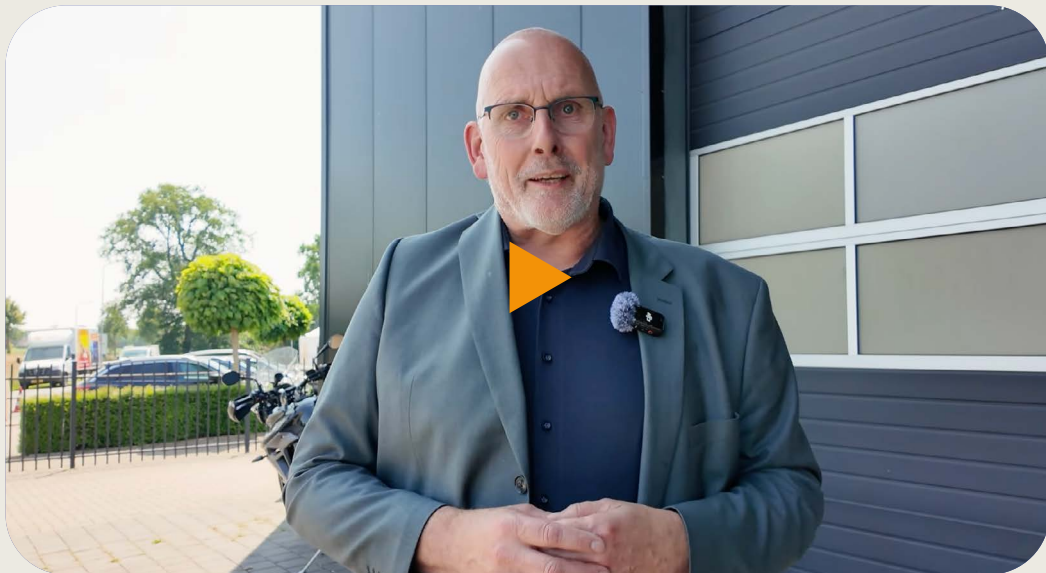
Video campagne Zelhem