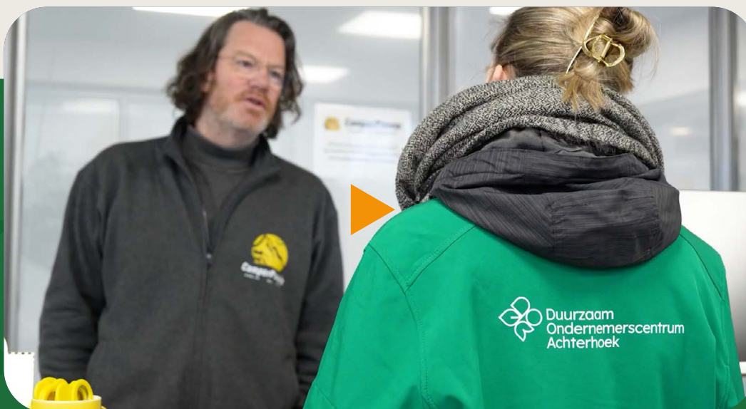
Video campagne Neede